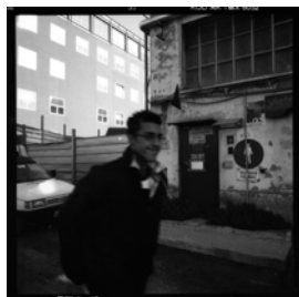
Paesaggi (de) industriali.

Nino Romeo. Nato a Bova Superiore (RC) e diplomato in fotografia presso l'istituto C.F.P. "Riccardo Bauer" di Milano. Lavora con la fotografia da oltre diciassette anni, collaborando con studi di architettura, compagnie teatrali e di danza, enti musicali, culturali e sociali. Conduce ricerche personali e commissionate nei campi dell'indagine territoriale e del reportage sociale, temi che in tutto il suo lavoro sono strettamente correlati. Tali ricerche sono sfociate in diverse pubblicazioni, mostre personali e partecipazione a mostre collettive in Italia e all'estero.