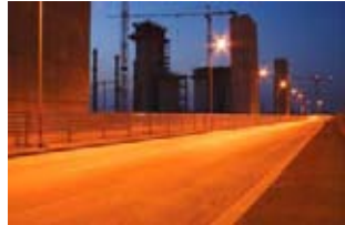
Rogoredo - Santa Giulia.

Gianni Maffi. (1957) Opera da lungo tempo nel campo della fotografia sia come autore che come organizzatore.