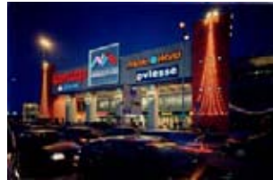
Non luoghi reiterati: spazi commerciali.