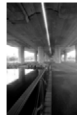
Marginalità, piazze e grandi vie di scorrimento.