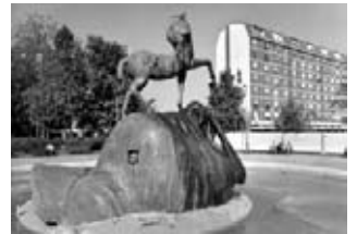
Quartiere Barona, dai '90 ai 2000.

Maurizio Totaro. (Milano, 1967) Vive e lavora a Milano dove è fotografo professionista dal 1990.