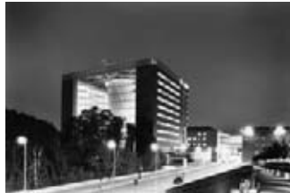
Milano Bicocca tra passato e presente.

Toni Nicolini (Milano, 1935) Uno dei più importanti esponenti della fotografia italiana, è conosciuto soprattutto per l'importanza delle sue collaborazioni editoriali di documentazione ambientale e geografica e per il suo straordinario archivio di immagini nelle quali si esprime la passione per gli aspetti quotidiani della vita, dell'abitare, degli spazi urbani e delle campagne. Nei primi anni '60 dedica un'importante ricerca fotografica a Melissa, in Calabria. Partecipa nel 1967 alla marcia di Danilo Dolci in Sicilia e testimonia con sorprendente ironia gli aspetti più mondani del costume di quegli stessi anni. Alle campagne fotografiche realizzate su incarico dell'ACI è seguita, dal 1970 al 1990, un'assidua collaborazione con il Touring Club Italiano, che gli ha commissionato numerosi volumi dedicati a città e monumenti. Ha ricevuto numerosi incarichi dalla Provincia di Milano, in particolare all'interno del Progetto Archivio dello spazio. Altra area d'interesse è la fotografia per l'industria. Da sempre affianca alla professione un impegno personale per la diffusione della cultura fotografica in Italia: ha lavorato con il Centro Cultura Fotografica di Luigi Croceni, negli anni ottanta ha collaborato con Aurelio Natali alle attività della Fondazione